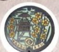
楼閣と水仙の花がポイントのマンホール

田原本は国史跡に指定された弥生時代の唐古・鍵遺跡に示されるように、歴史の深い奈良のなかでも古くから栄えた町。古代道路下ツ道の名残りである中街道沿いに発展した近世の寺内町や平野氏陣屋のたたずまいを残す町並みを抜け、名所・旧跡をめぐり、歴史ロマン満喫の田原本ウォーキング！